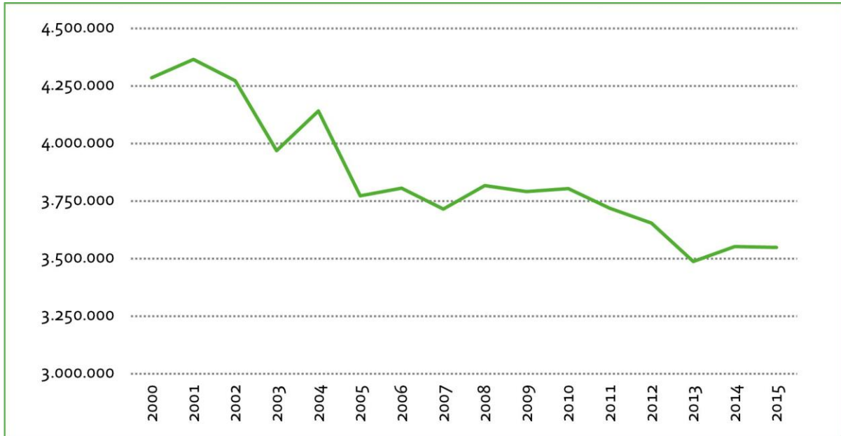
Abb. 1: Geschlachtete Rinder pro Jahr in Deutschland, einschließlich Milchkühe, Mastrinder, Jungrinder, Kälber (Quelle: Statistisches Bundesamt).